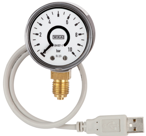
Manómetro de muelle tubular modelo PGT10-USB